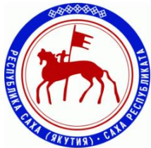
Р. Саха Якутия

Субъект не обеспечивает выплату компенсации